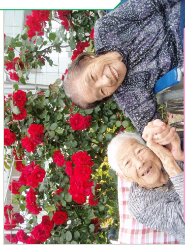
宇部空港パラ園にて